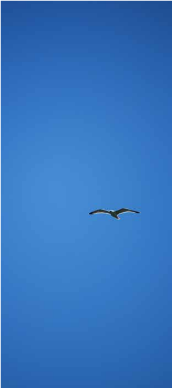
OASI WWF LAGO DI CONZA CONZA DELLA CAMPANIA