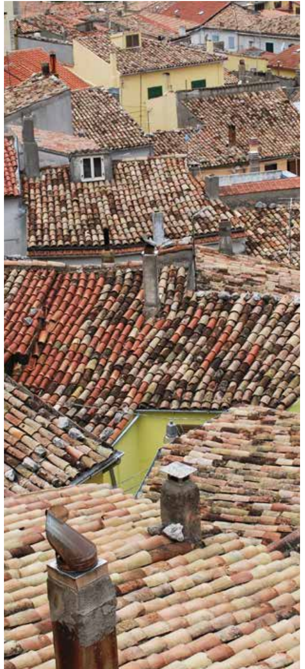
CENTRO STORICO SANT'ANDREA DI CONZA