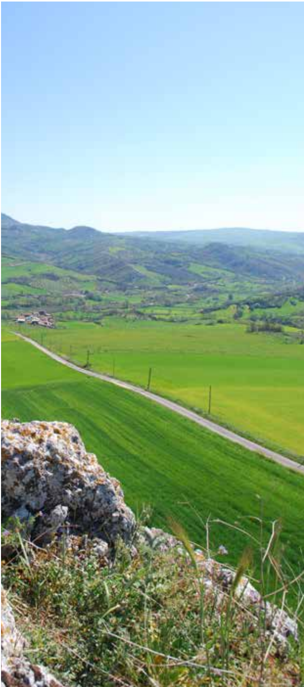
SANT'ANGELO AL PESCO FRIGENTO