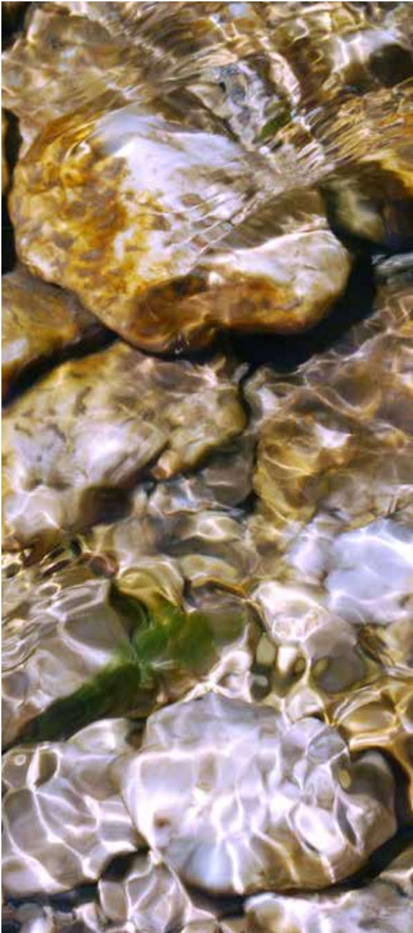
FIUME CALORE MONTELLA