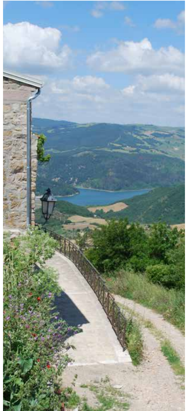
BORGO - LAGO SAN PIETRO MONTEVERDE