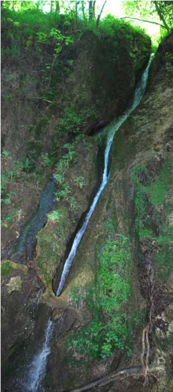
OASI VALLE DELLA CACCIA SENERCHIA