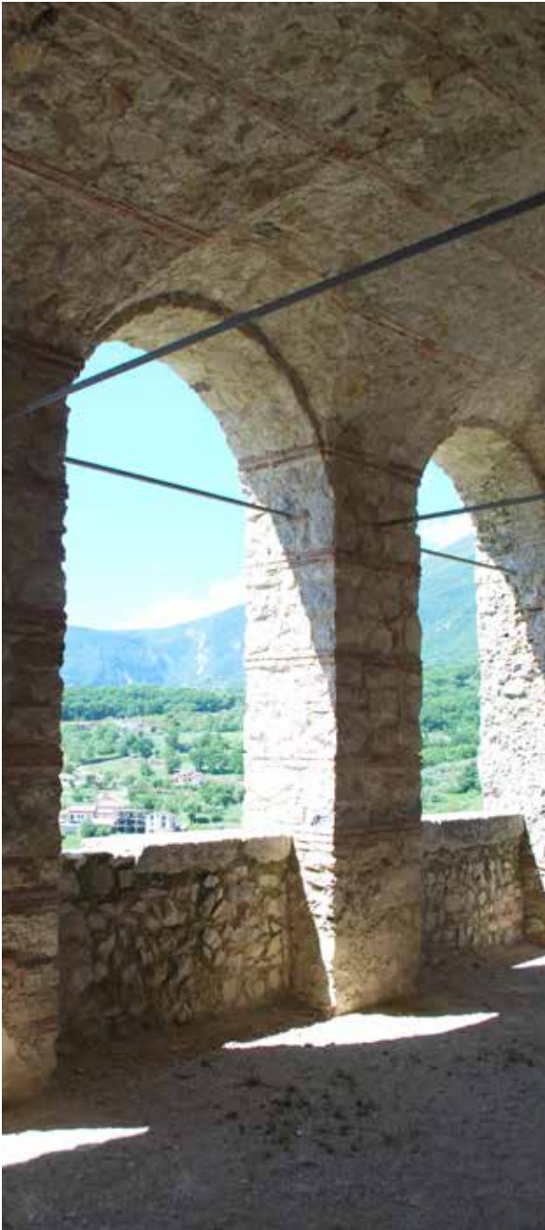
CASTELLO DI QUAGLIETTA CALABRITTO